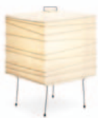
Akari 3X 380 x 230 x 230 mm Art. 201 578 01