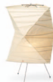
Akari 26N 610 x 350 x 350 mm Art. 201 576 01