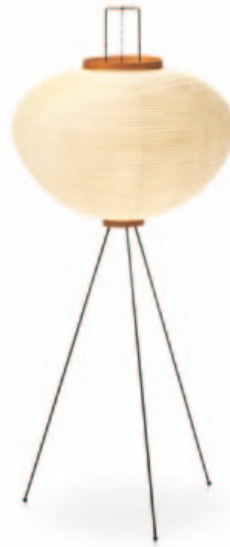
Akari 10A 1230 x 530 x 530 mm Art. 201 530 01

Het werk van de Amerikaans-Japanse kunstenaar en vormgever Isamu Noguchi (1904–1988) is bijzonder gevarieerd. Behalve beelden ontwierp hij ook toneeldecors, meubelen, lampen, interieurs, openbare ruimten en tuinen. Als beeldhouwer ging zijn belangstelling niet alleen uit naar materiaal en vorm, maar ook naar de ruimtelijke werking en de vormgeving van de ruimte zelf. Zijn kunst moet ook een praktische en sociale functie vervullen en met zijn stijl van beeldhouwen oefende hij een blijvende invloed uit op de vormtaal van de organische designs van de jaren '50.