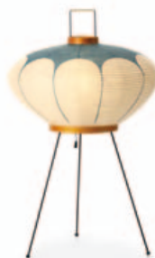
Akari 9AD 670 x 440 x 440 mm Art. 201 586 01