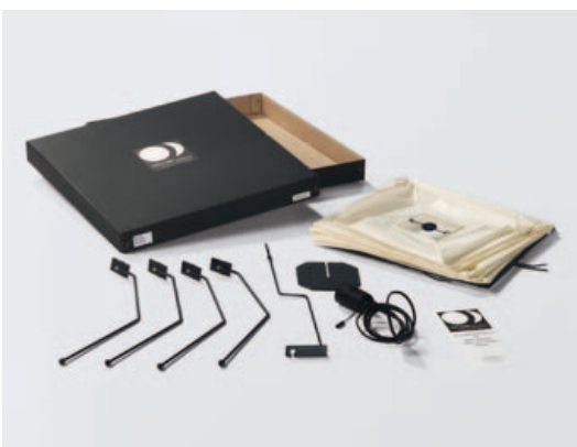
Akari Light Sculptures werden mit schwarzem Anschlusskabel (Eurostecker, CEE 7 / 16), aber ohne Leuchtmittel geliefert. Wir empfehlen die Verwendung von Energiesparlampen (Fassung E27 / 230V).

Chacune des lampes est minutieusement fabriquée à la main dans la manufacture Ozeki, une entreprise familiale, dans la ville de Gifu. Des tiges de bambou sont d'abord tendues sur le modèle original, créé par Noguchi, et constituent l'ossature qui déterminera ensuite les contours de la lampe. Du papier fait main « shoji », tiré de l'écorce du mûrier, est découpé en bandelettes dont la taille est fonction de la forme de l'abat-jour, bandelettes ensuite collées sur la structure en bambou. Après le séchage, l'ossature intérieure est enlevée et l'abat-jour peut être plié. Pour l'expédition ou le rangement, les Akari Light Sculptures sont pliées et emballées dans des cartons plats spéciaux, conçus à cet effet.