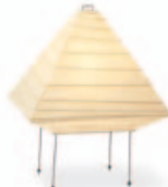
Akari 5X 390 x 300 x 300 mm Art. 201 580 01