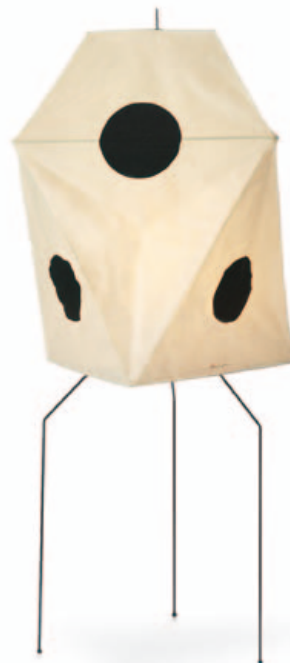
Akari UF3-Q white/black, 1450 x 560 x 560 mm Art. 201 557 01