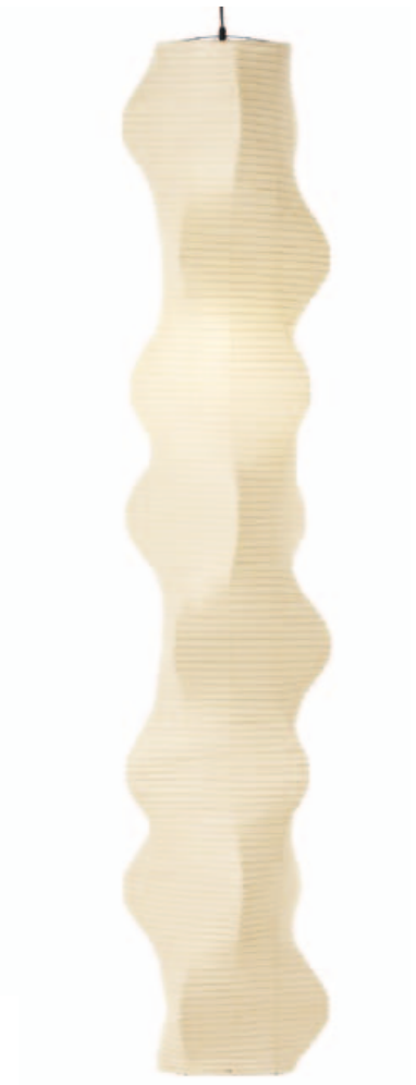
Akari B 2350 x 460 x 460 mm Art. 201 584 01