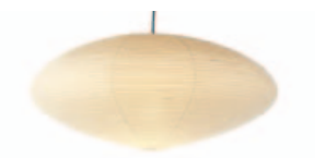
Akari 26A 250 x 450 x 450 mm Art. 201 507 01