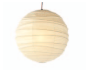
Akari 55D 520 x 550 x 550 mm Art. 201 515 01