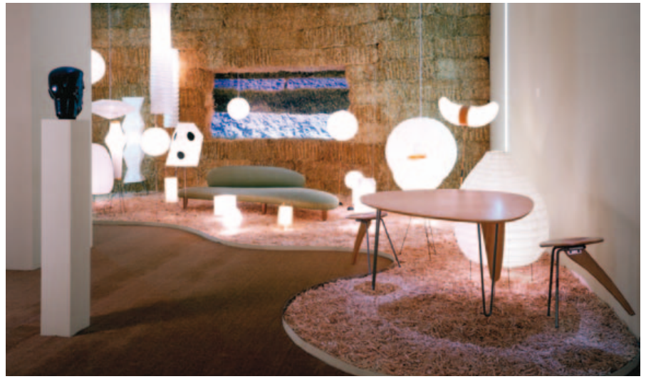
Isamu Noguchi Ausstellung im Vitra Design Museum Exposition sur Isamu Noguchi au Vitra Design Museum Tentoonstelling Isamu Noguchi in het Vitra Design Museum