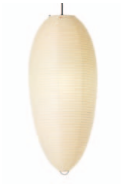
Akari 23A 700 x 320 x 320 mm Art. 201 583 01