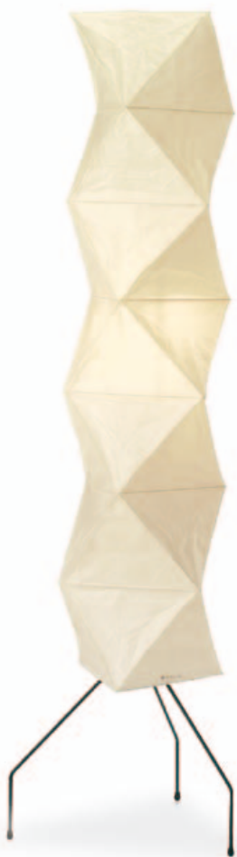
Akari UF4-L8 1880 x 410 x 410 mm Art. 201 562 01