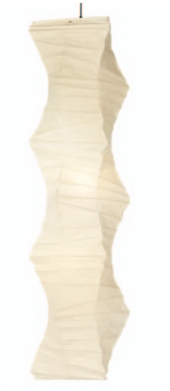
Akari 33N 1600 x 470 x 470 mm Art. 201 522 01