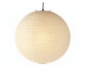
Akari 45A 450 x 450 x 450 mm Art. 201 508 01