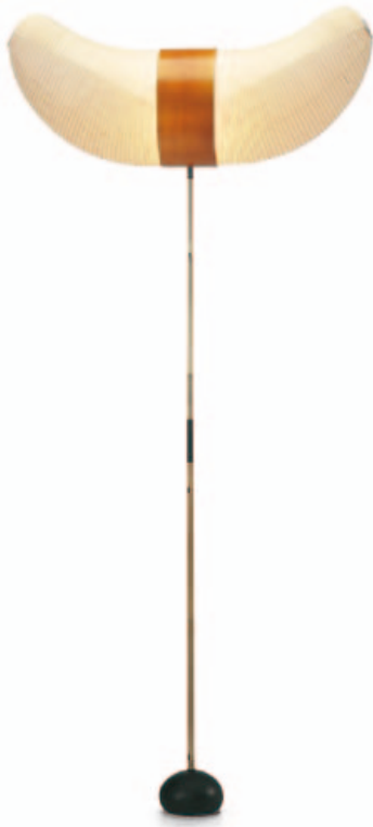
Akari BB3-33S 1700 x 750 x 750 mm Art. 201 536 01