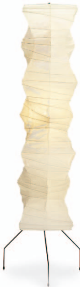
Akari UF4-33N 1900 x 470 x 470 mm Art. 201 559 01