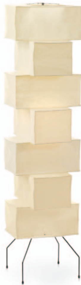
Akari UF4-L10 1930 x 480 x 480 mm Art. 201 560 01