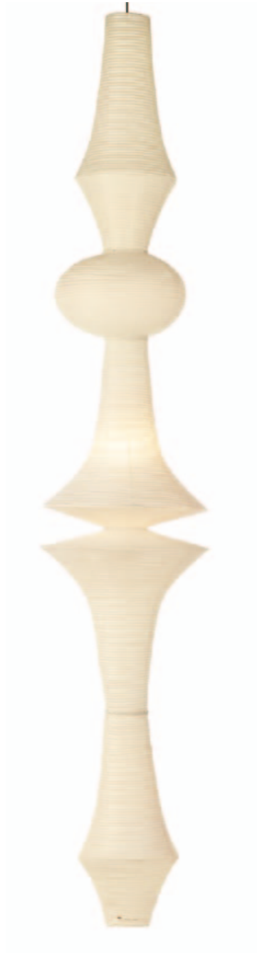
Akari E 2950 x 480 x 480 mm Art. 201 527 01