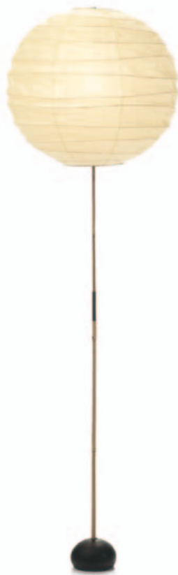
Akari BB3-55DD 1850 x 530 x 530 mm Art. 201 537 01