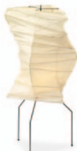
Akari UF2-33N 710 x 300 x 300 mm Art. 201 552 01