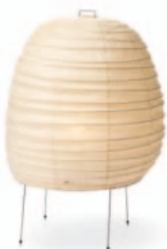
Akari 20N 630 x 420 x 420 mm Art. 201 574 01