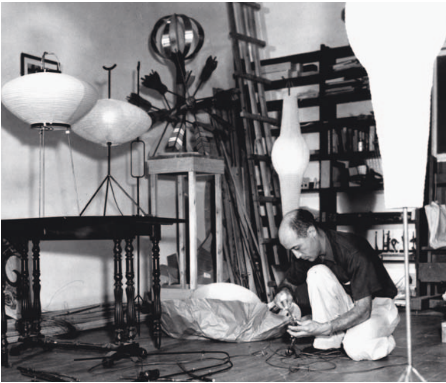
Noguchi mit frühen Akaris, 1950er Jahre Noguchi avec les premières akaris, années 50 Noguchi met de eerste Akaris uit de jaren '50

1951 entwarf Isamu Noguchi die Akari Light Sculptures, Skulpturen von leuchtender Schwerelosigkeit. Als Bezeichnung wählte er das Wort „akari“, den japanischen Ausdruck für Helligkeit und Licht, der auch Leichtigkeit beinhaltet. Auf einer Reise nach Japan besuchte Noguchi die Stadt Gifu, die für die Herstellung von Papierschirmen und -laternen bekannt ist. Dort skizzierte er seine beiden ersten Akari Light Sculptures und in den folgenden Jahren schuf er insgesamt über 100 Modelle, Tischleuchten, Steh- oder Deckenleuchten in Größen von 24 cm bis zu 290 cm.