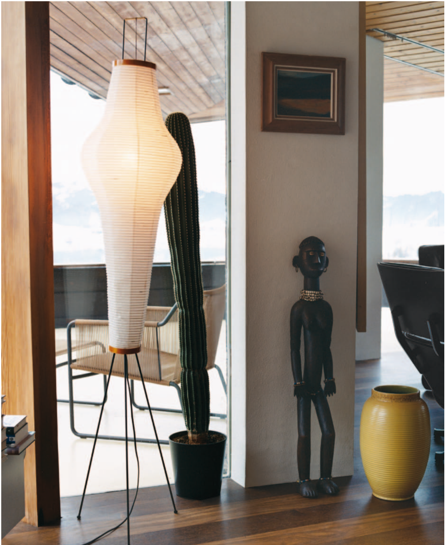
Photography: Ramesh Amruth, Isamu Noguchi Foundation, A. Sütterlin. © Vitra Design Museum 09/2008