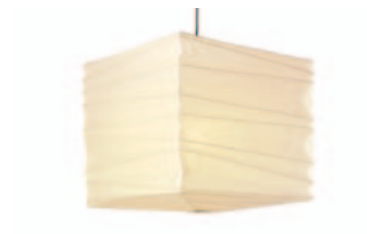
Akari 45X 430 x 430 x 430 mm Art. 201 525 01