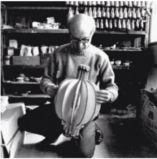
Noguchi in Gifu/Japan, 1978 Noguchi à Gifu (Japan), 1978 Noguchi in Gifu/Japan, 1978