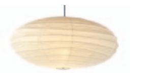
Akari 50EN 250 x 500 x 500 mm Art. 201 518 01