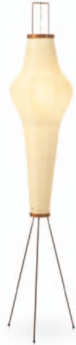
Akari 14A 1580 x 510 x 510 mm Art. 201 531 01