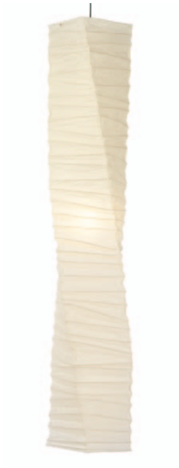
Akari J1 1880 x 250 x 250 mm Art. 201 501 01